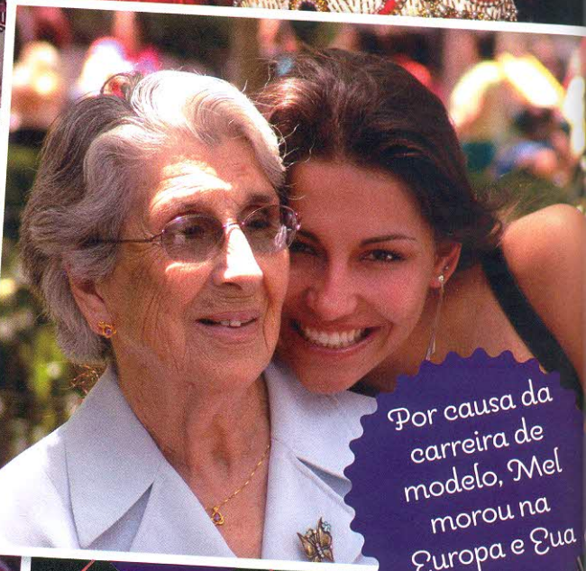
Por causa da carreira de modelo, Mel morou na Europa e EUA